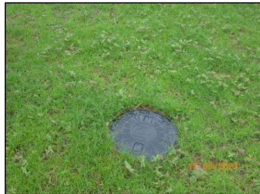
ระบบสุขาภิบาลเป็นรูปแบบ Mobile Toilet Container รูปที่ 1-4 (ต่อ) สภาพพื้นที่ภายในลานจอดรถของโครงการ