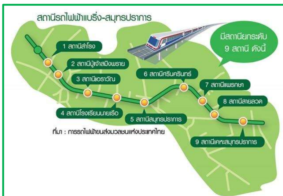
รูปที่ 1-1 สถานีรถไฟฟ้าสายสีเขียว ช่วงแบร์ริง-สมุทรปราการ

พื้นที่โครงการรถไฟฟ้าสายสีเขียว ช่วงแบร์ริง-สมุทรปราการ จะต่อจากแนวโครงการระบบขนส่งมวลชนกรุงเทพมหานคร สายสุขุมวิทช่วงอ่อนนุช-แบร์ริง พื้นที่โครงการอยู่ในพื้นที่ของจังหวัดสมุทรปราการ มีสถานีรถไฟฟ้ายกระดับ จำนวน 9 สถานี ได้แก่ สถานีสำโรง สถานีปู่เจ้าสมิงพราย สถานีอ่าววัน 6 สถานีศรีนครินทร์ 7 สถานีแพรกษา 8 สถานีสายลวด และสถานีเคหะสมุทรปราการ รวมทั้งมีลานจอดรถ จำนวน 1 แห่ง บริเวณสถานีเคหะสมุทรปราการ