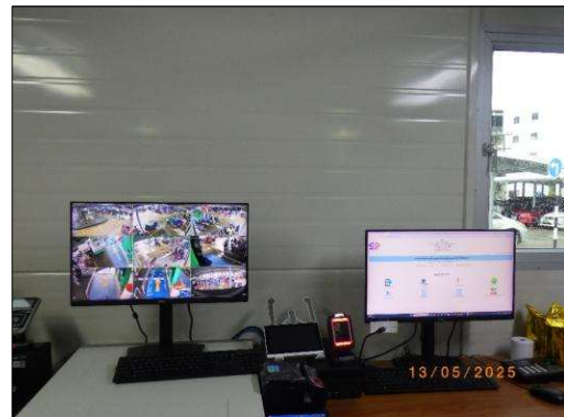
สำนักงาน Mobile Office Container และสำนักงาน Mobile Rescue Office Container