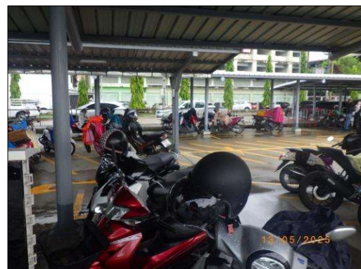
บริเวณพื้นที่จอดรถจักรยานยนต์