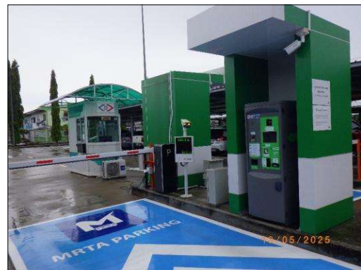
ตู้จ่ายบัตรจอดรถ (Ticket Booth)