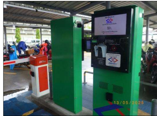
ตู้จ่ายบัตรจอดรถ (Ticket Booth) (ต่อ)